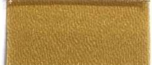
Lamè 8 21