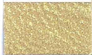
Lamè 10 101