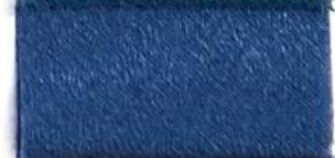
Lamè 8 18