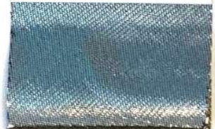
Lamè 11 102