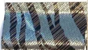
Lamè 30 42