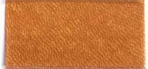
Lamè 8 4