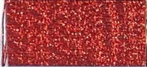
Lamè 2 113