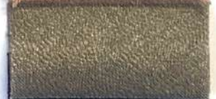
Lamè 8 10