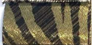
Lamè 30 41