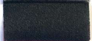
Lamè 8 2