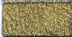
Lamè 22 101