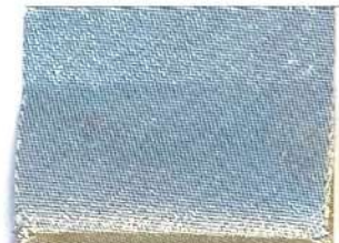
Lamè 101 102