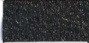
Lamè 22 105