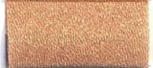
Lamè 8 3