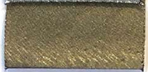
Lamè 11 101