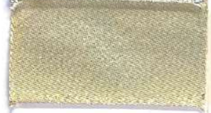
Lamè 101 101