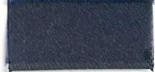
Lamè 8 19