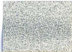
Lamè 2 102