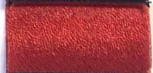
Lamè 8 14