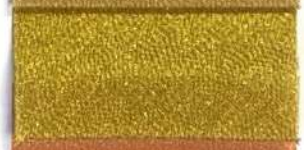
Lamè 8 7