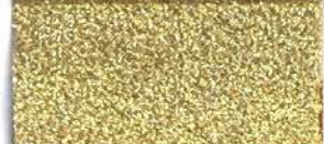
Lamè 2 101