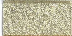
Lamè 2 104