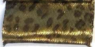
Lamè 30 151