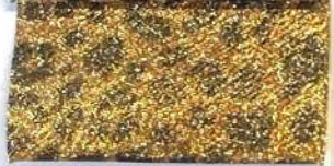
Lamè 31 151