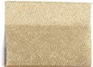
Lamè 8 5