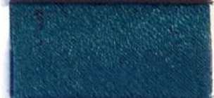
Lamè 8 16