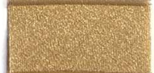
Lamè 8 6