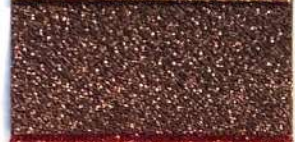
Lamè 2 106