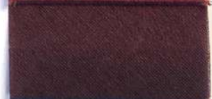
Lamè 8 15