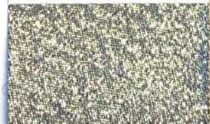
Lamè 22 102