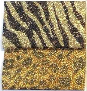
Lamè 31 41