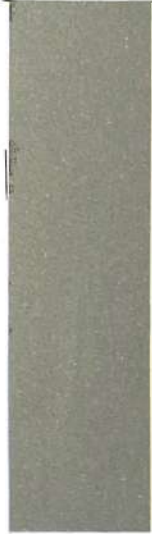
RIFLETTENTE EF col 1