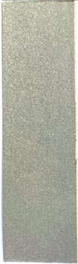
RIFLETTENTE 3X col. 1