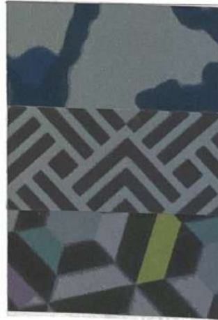
ASTRO col 2