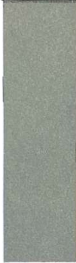
RIFLETTENTE K col 1