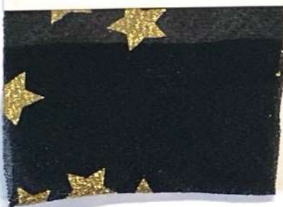
LUREX 3 1