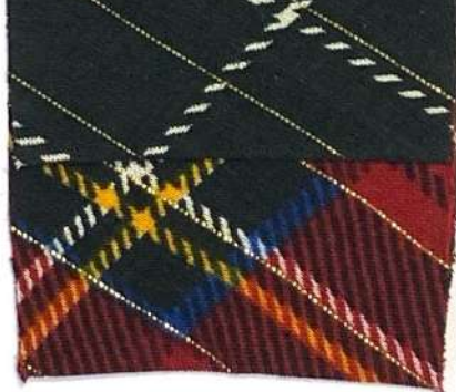
LUREX 2 1